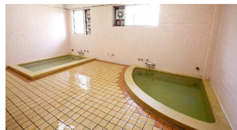
毎日清潔な浴室です。