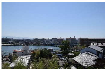
セトル名島より那珂川を望む